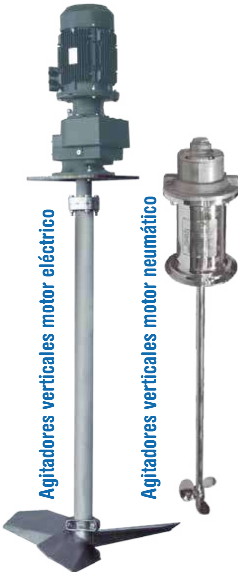
Agitadores verticales motor eléctrico